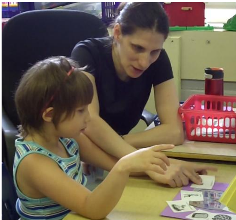
Phrases construites avec des pictogrammes à partir de la photographie