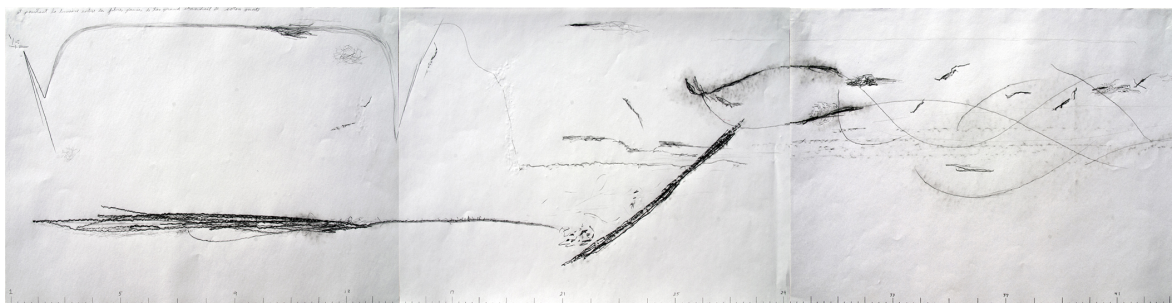
Figure 3: Symon Henry, Intranquillités I : Vergangenheitsbewältigung , 2013, p. 1 à 3 de la partition de quatuor à cordes.

sont invité·e·s à respecter un ensemble de conventions 75 laissant une large place à l'interprétation personnelle. Cette marge de manœuvre qui leur est offerte remet en question de facto l'autorité traditionnelle du compositeur. La partition, finalement, exige des interprètes une grande virtuosité ancrée dans les fondements de la pratique de leur instrument — maîtrise du souffle pour les instruments à vent ou exploration du frottement pour les cordes —, sans jamais ouvrir franchement la porte à des modes de jeux standards. Les partitions de cette série ont été les premières que j'ai réalisées en les pensant pour qu'elles puissent être « entendues » hors du sonore par le public, spécialisé ou non, grâce à quelques clefs simples d'interprétation.