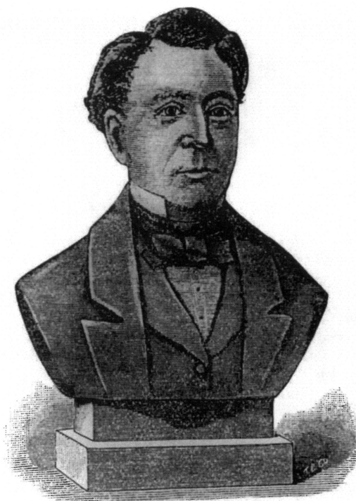
Pierre-Stanislas Bédard (1762-1829) principal rédacteur du journal Le Canadien entre 1806 et 1810.

associés à lancer leur propre journal, lequel donnera désormais la réplique à son vis-à-vis anglophone.