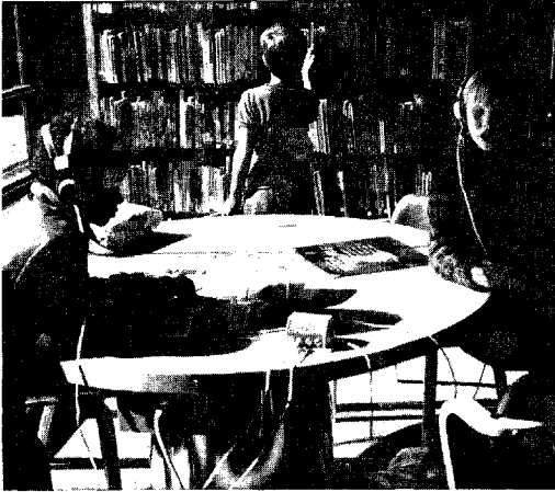
Quel plaisir de feuilleter une revue tout en écoutant ensemble de la musique de choix. Bibliothèque Albion Mall (Etobicoke)