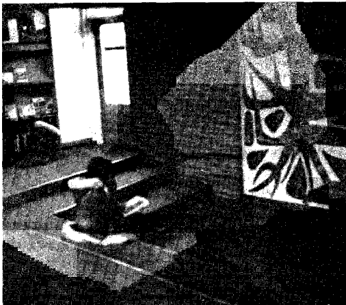
En compagnie d'un livre captivant, que demander de plus? Bibliothèque North York

X (no J) Picture books especially to be read to pre-schoolers