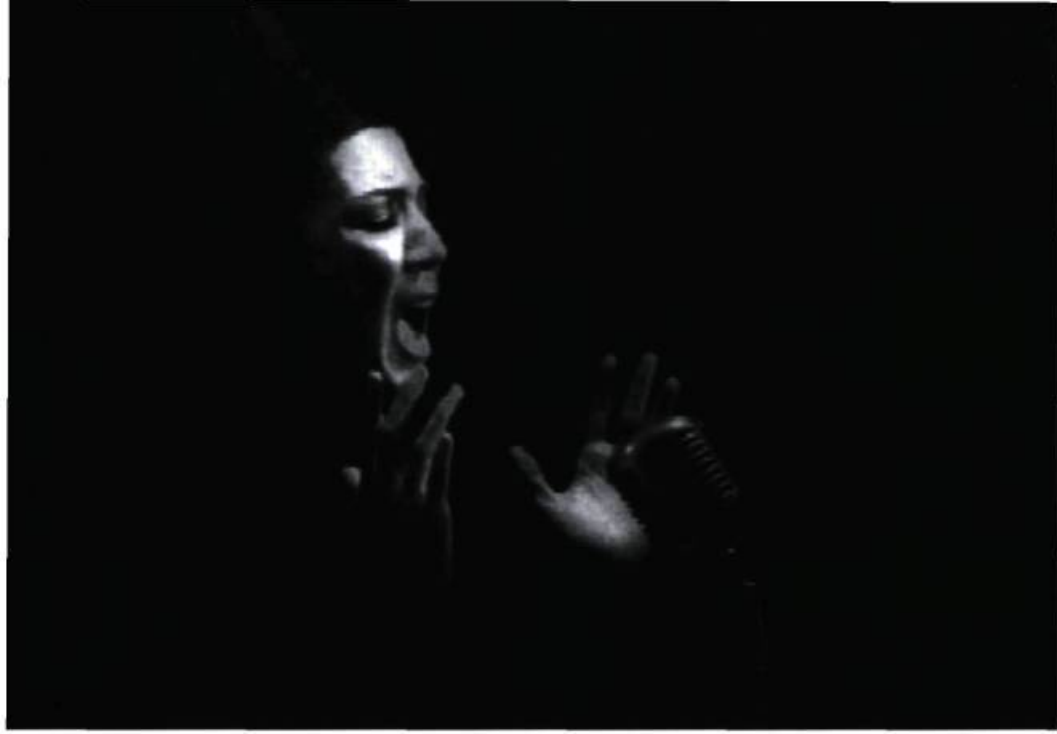
Turbulent video still 1998