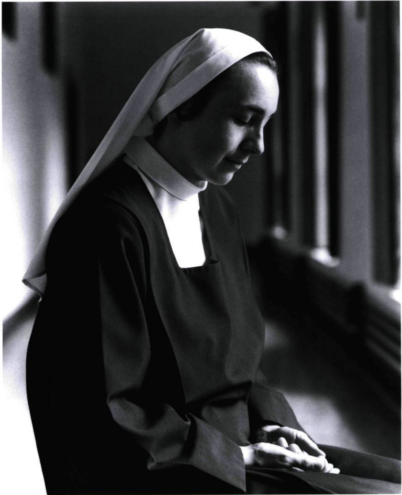
Les Sœurs Carmélites Le cloître Montréal, 1996