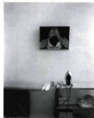
Le Monastère des Sœurs Adoratrices du Précieux-Sang