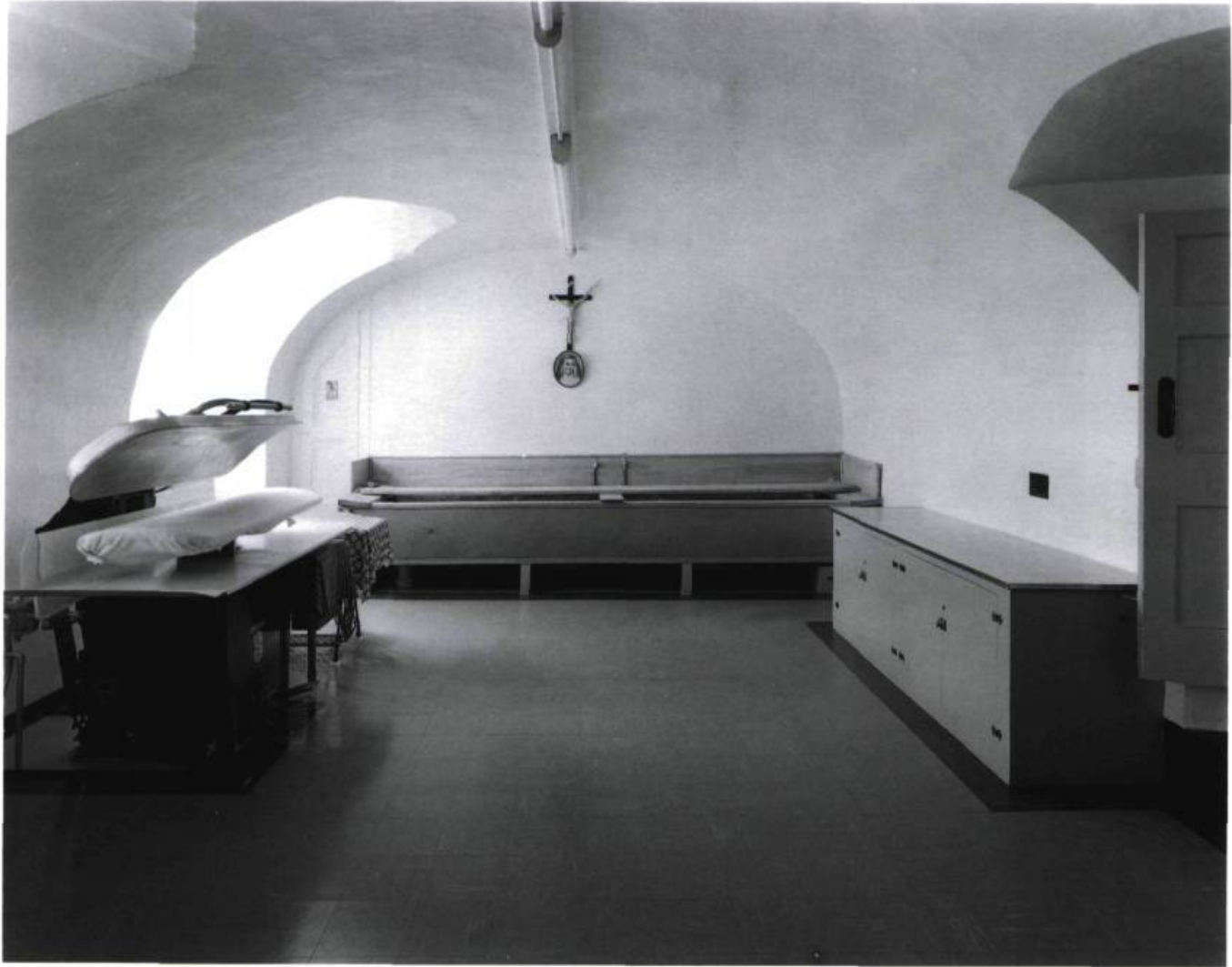
Le Monastère des Sœurs Ursulines Une buanderie Québec, 1991