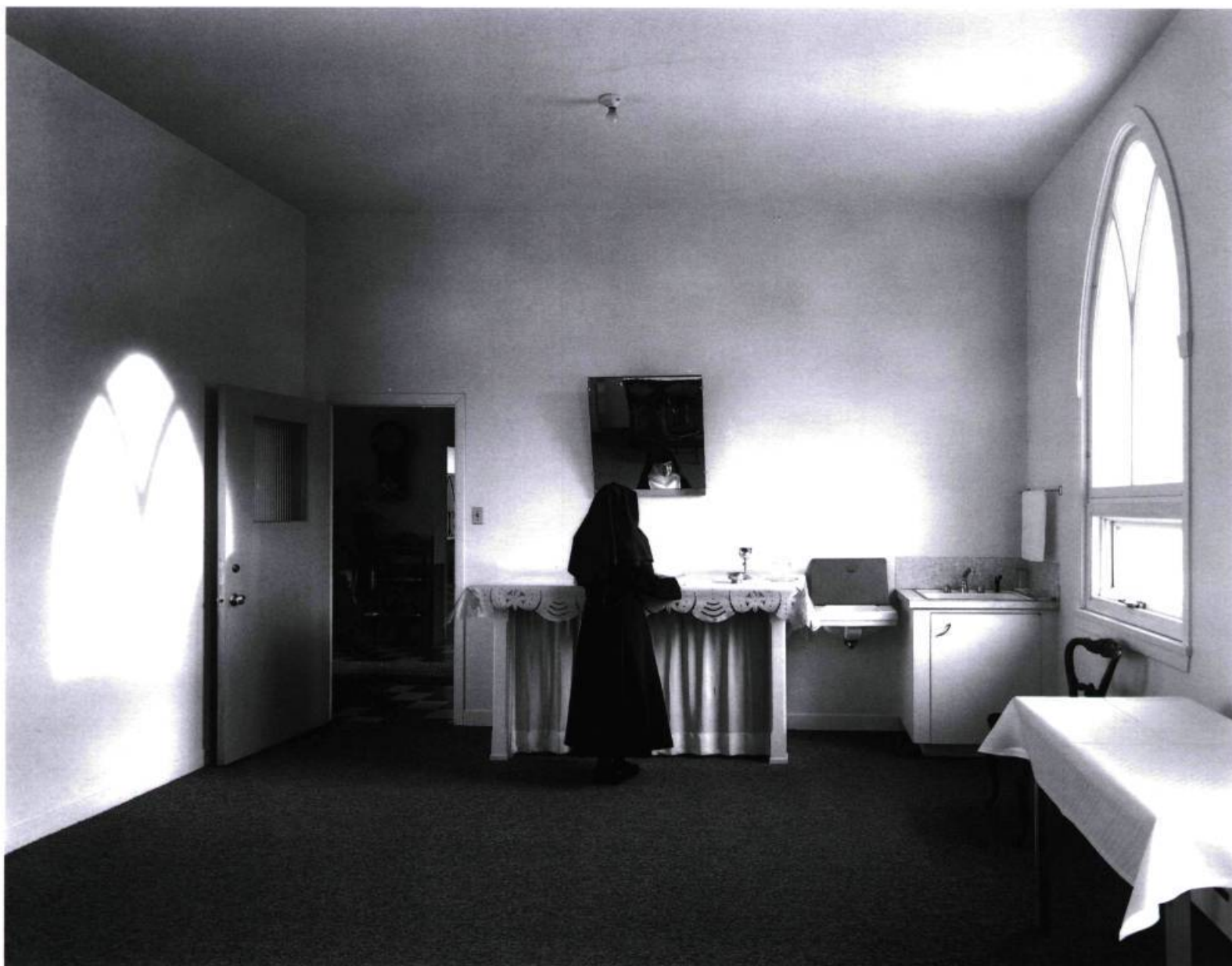
Les Sœurs de la Visitation La sacristie La Pocatière, 1991