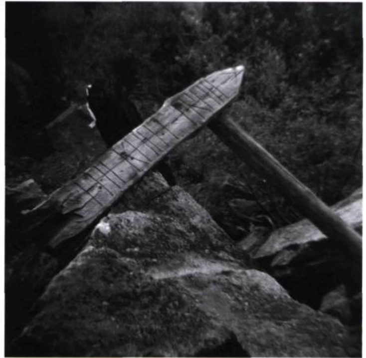
Chilkoot Trail, Alaskan side / Yukon River at Dawson City / Chilkoot Trail, Yukon side Eileen Leier, 1997