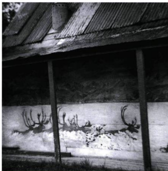
Chilkoot Trail, Alaskan side / Dawson City, Yukon Eileen Leier, 1997

# 6390 Yukon Archives Photographer unknown 1898