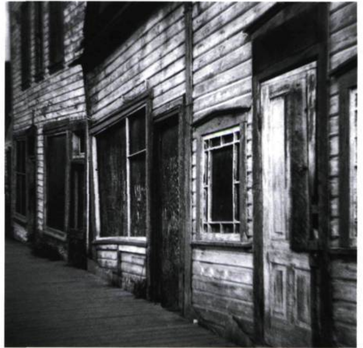
# C-63225 National Archives Photographer unknown 1898