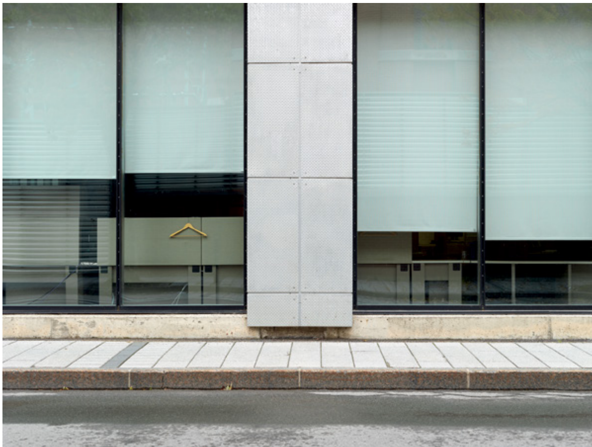
Horizon #052 (Havana), 2017, 110 × 147 cm True Nature #031 (Montreal), 2018, 20 × 27 cm