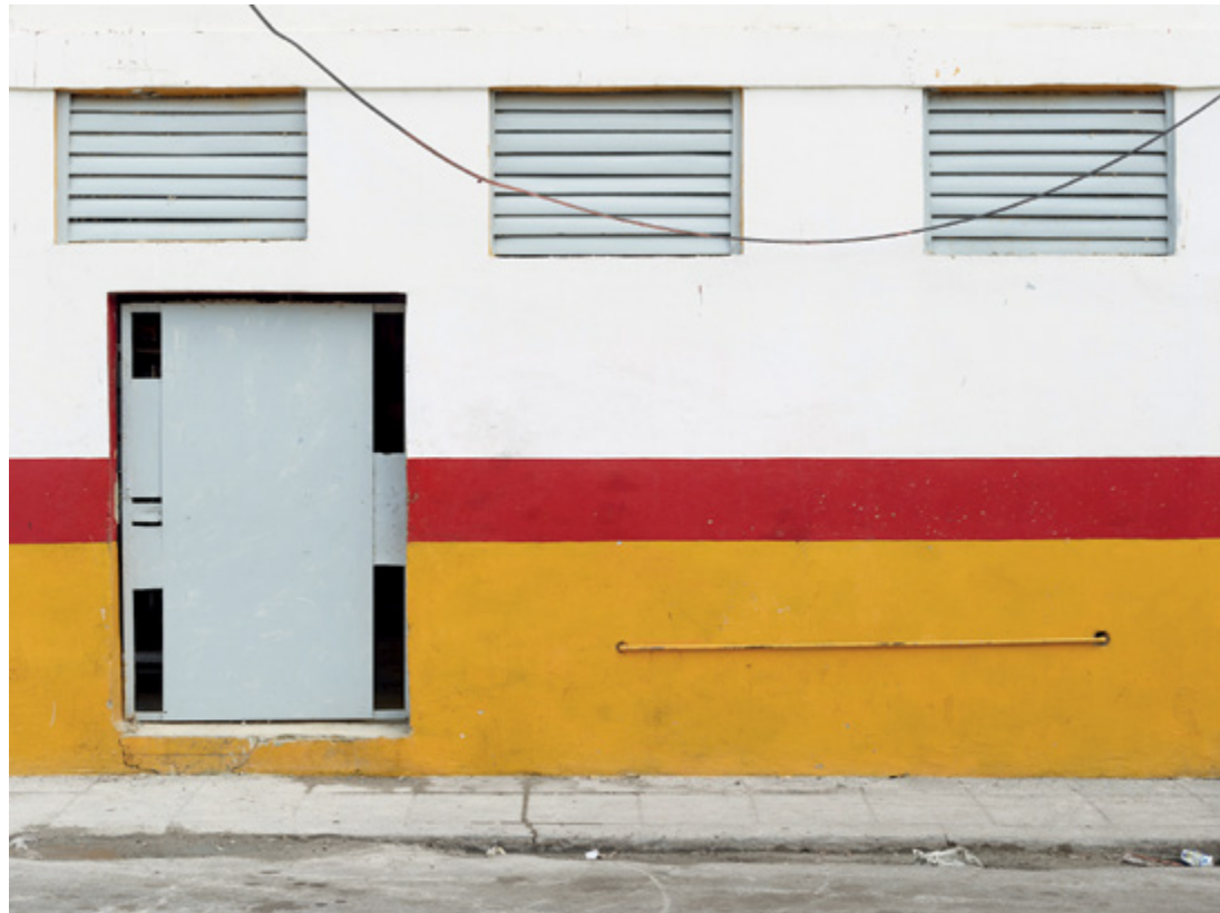
True Nature #054-069 (Havana), 2017 60 x 80 cm ea./ch.