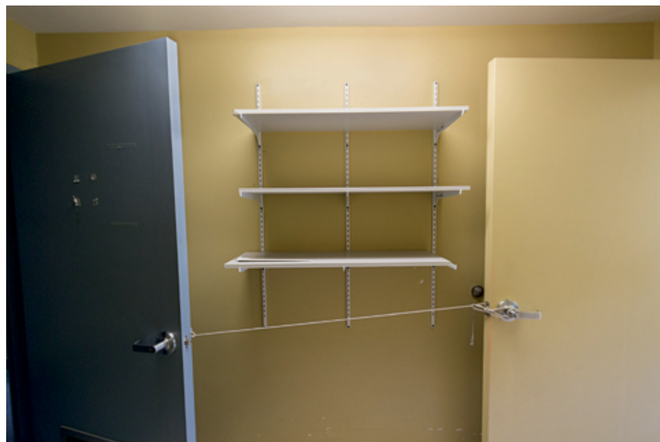
Angela Grauerholz Entre deux portes / Between Two Doors, 2017 76 × 114 cm