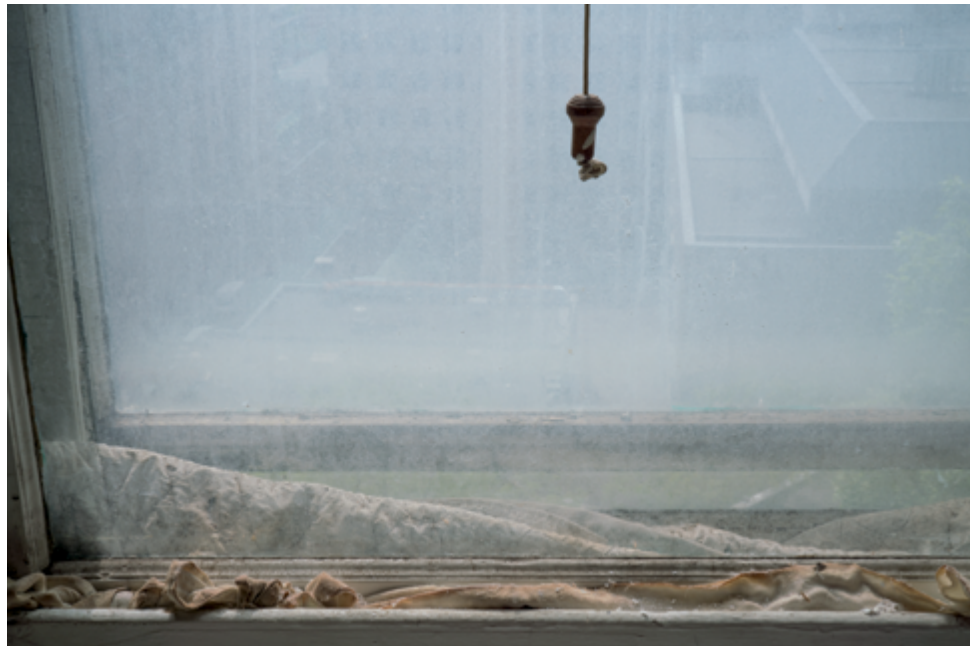
Raymonde April Détail d'une fenêtre, Hôpital Royal Victoria / Detail of a Window, Royal Victoria Hospital, 2017 91 x 137 cm