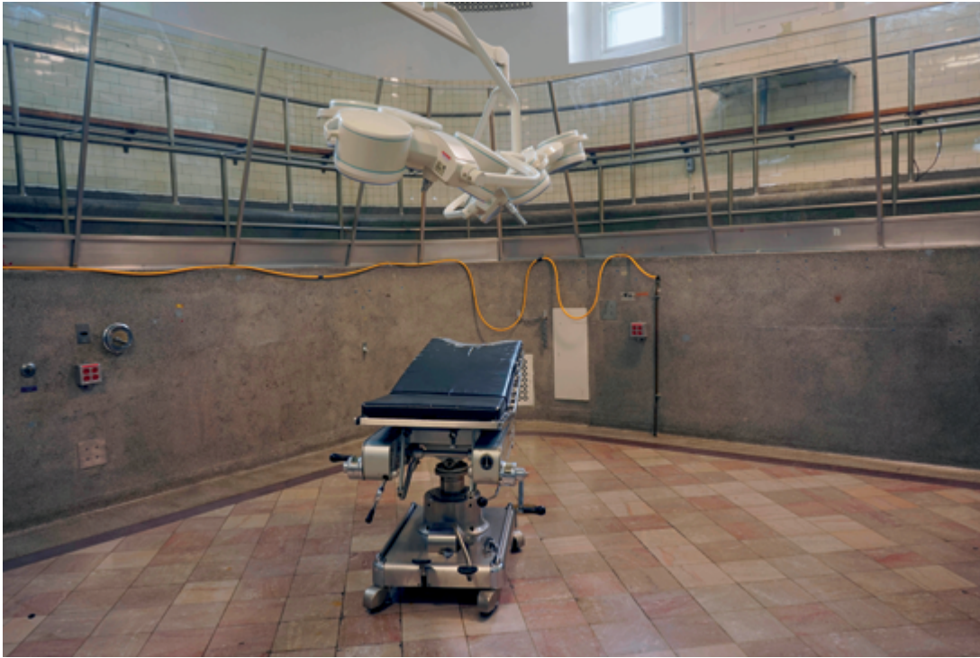
Gabor Szilasi Bloc opératoire (1924) / Operating theatre (1924), 29 mars, 2017 91 × 137 cm