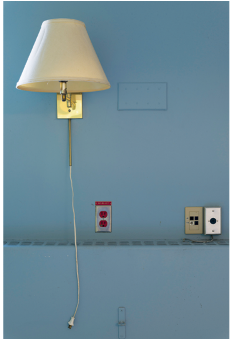
Chih-Chien Wang Mur bleu avec lampe / Blue Wall with Lamp, 2017 137 × 91 cm