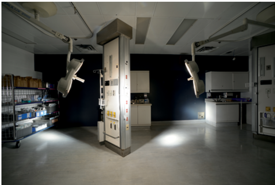
Marie-Jeanne Musiol L'échappée de Diane / Diane's Escape , 2017 76 × 114 cm