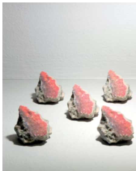
3D printed Berlin Wall Souvenir(s) / Souvenir(s) du mur de Berlin imprimés en 3D installation view / vue d'installation, and detail of twelve 3D printed copies of a Berlin Wall souvenir acquired at Checkpoint Charlie, Berlin, by the artists / et détail de douze copies en 3D d'un souvenir du mur de Berlin acquis à Checkpoint Charlie, Berlin, par les artistes 2017, Prefix ICA

eBay entrepreneurship. Ronald Reagan's call, in 1987, to "Tear down that wall!" seems, in retrospect, a demand for new commodities, as over two thirds of the Berlin Wall are now in the United States. The country most antagonistic to the Soviet project was also the quickest to capitalize from it.