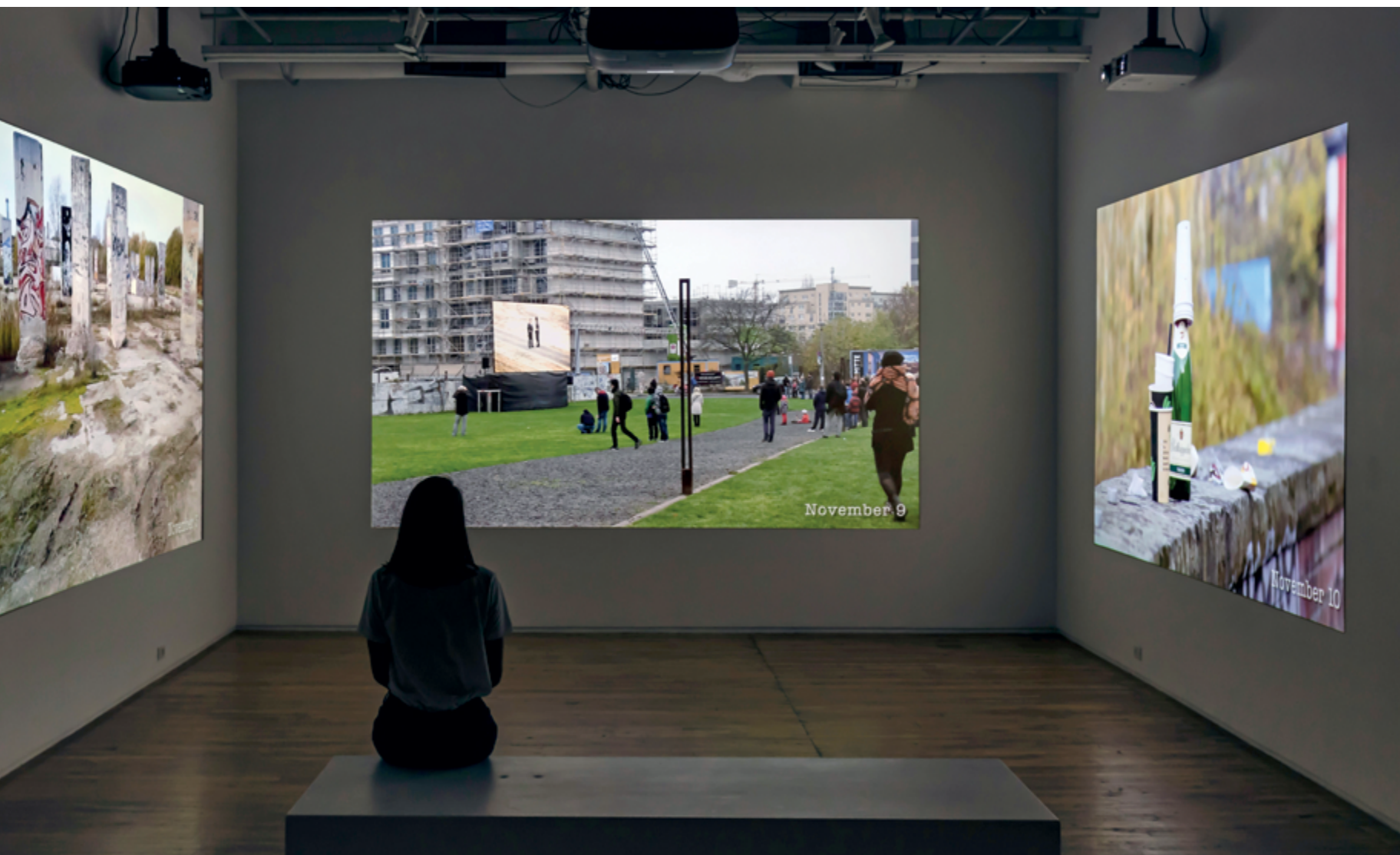
Labour of Commemoration , 2017 installation view / vue d'installation, Prefix ICA three-channel video / vidéo trois canaux 46 min, photo: Toni Hafkenscheid