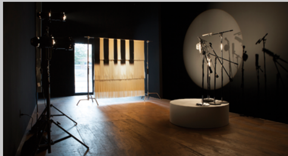
Vue d'exposition

la vidéo. Les menottes, les socles, les costumes et les instruments de musique qui apparaissent dans l'image en mouvement font écho aux artefacts qui constituent les œuvres physiques de la salle. L'opacité des matériaux qui forment l'impénétrable et dérangent rideau de cheveux, ou encore la mise en échec des micros rendant impossible toute forme de communication, indiquent l'inefficacité de la parole et signalent un manque de transparence des actions menées par les corps politiques dans un contexte mondial où les violences sociales ne font que s'amplifier. La théâtralité et la fiction inhérentes aux œuvres de l'exposition