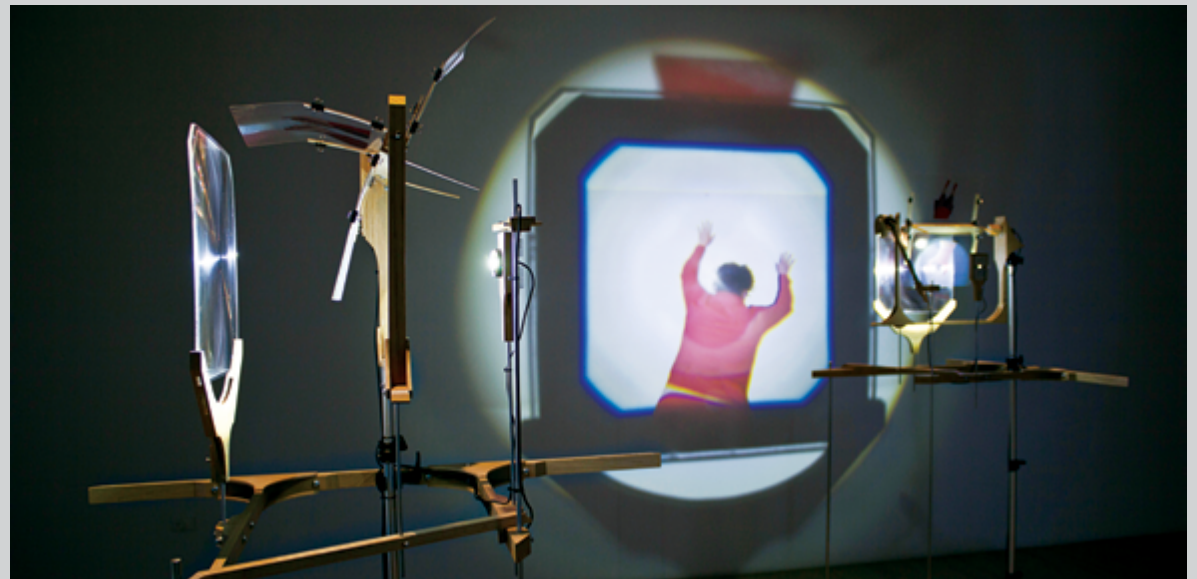
moulin à prières (détail), 2015, installation cinématique et sonore, photo : Manon Labrecque

Cet effort de correspondre à son ombre, on le retrouve aussi dans l'œuvre présentée dans la salle arrière, en projection. Avec apprentissage , c'est un personnage féminin, aux abords non définis, qui se profile, légèrement plus