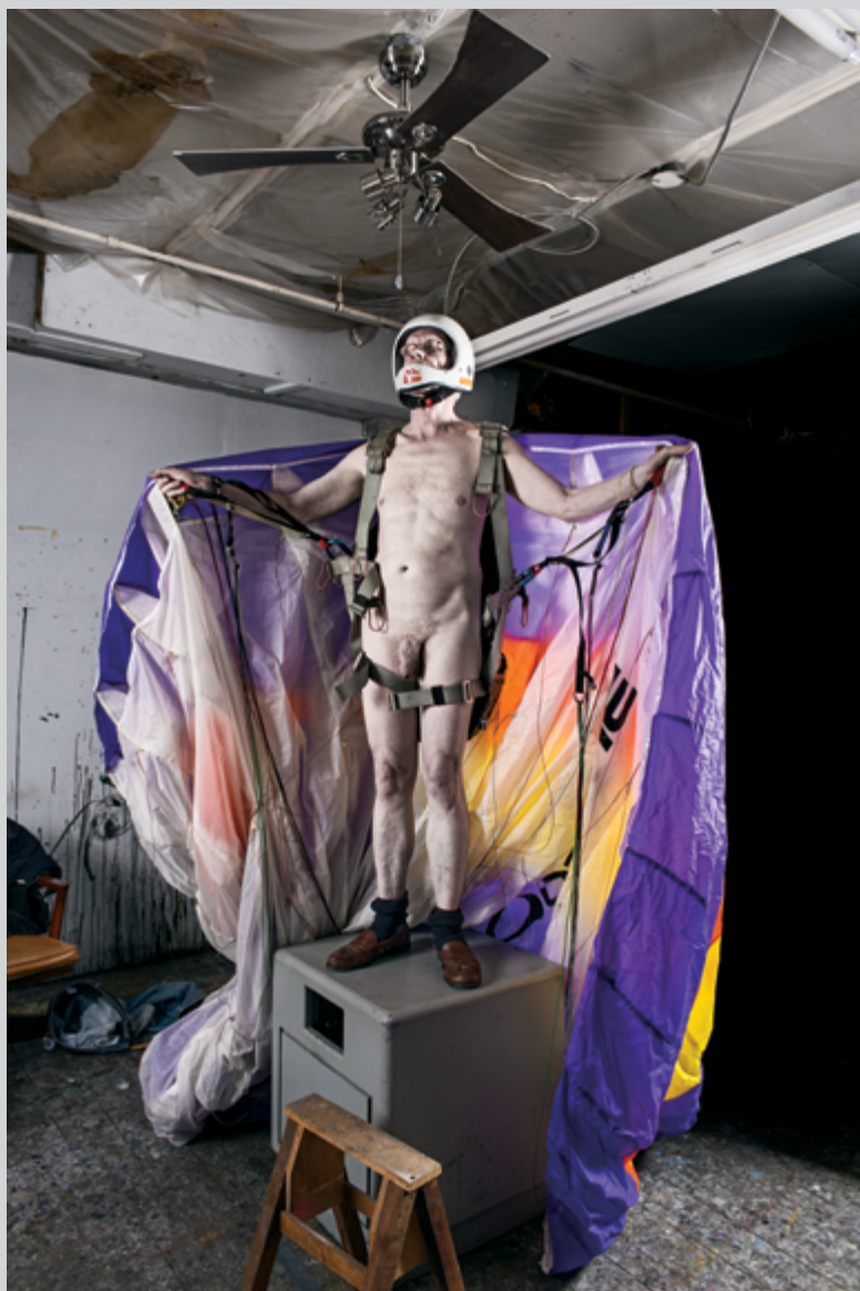
Doyen des pilotes , 2016