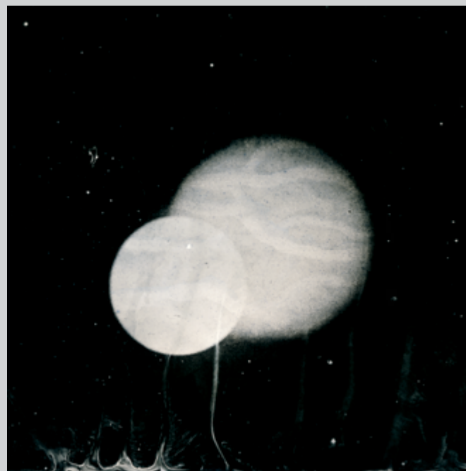
Double Moon Crossing , from the series Les révolutions sidérales , c-print, 2016, 81 × 81 cm