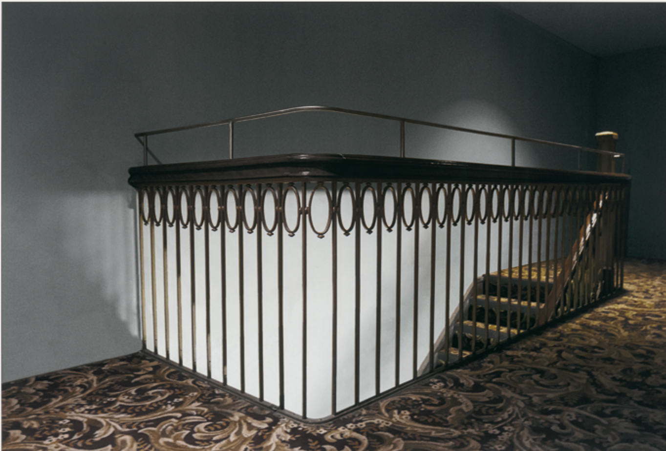
Angela Grauerholz Puits de lumière / Light Well 2014, impression à jet d'encre / inkjet print 103 x 154 cm

TOUTES LES ŒUVRES / ALL WORKS FROM Collection d'art canadien du Musée des beaux-arts de Montréal / The Montreal Museum of Fine Arts