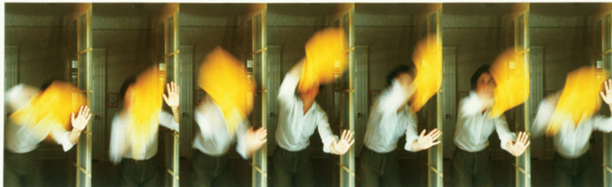
Sorel Cohen The Shape of a Gesture 1977, photomontage 51 x 102 cm

âge où sont mises en relief la diversité de la vie au quotidien de ces gens et la valeur testimoniale de leur vécu. Sans titre (Main) , une image en noir et blanc de Cadieux datant de 1997, vient clore cette section avec un avant-bras dénudé de femme d'âge mûr, qu'on pourrait voir aussi bien comme un paysage que comme une nature morte.