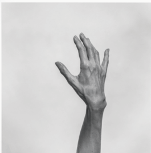
Geneviève Cadieux Sans titre (Main) , 1997 épreuve argentique / silver print 57 x 50 cm

en noir et blanc d'Angela Grauerholz, Bâle (1986), où l'eau s'avancant vers nous entre deux rangs de maison a tout de l'épaisseur fluide d'une peinture. Isabelle Hayeur, avec son Refuge (2002-2005), présente un couloir délabré entre deux immeubles, avec débris à l'avant-plan, vers lequel se dirige un personnage apparaissant au fin fond de l'image – une version contemporaine et désolante du paysage, dont le titre évoque l'idée d'itinérance. Le collage d'illustrations de magazines de Marnie Weber intitulé Jardin de pierre (2001) fait contrepoids à l'image précédente avec sa succession de figures féminines, de cygnes, son temple grec et sa reproduction de Psyché ranimée par le baiser de l'amour. La forêt enchantée (1999) de Holly King est aussi un paysage construit, non pas sous forme de collage, mais résultant du bricolage minutieux de l'artiste qui, dans sa démarche, tend vers le sublime, le fantastique et l'illusoire.