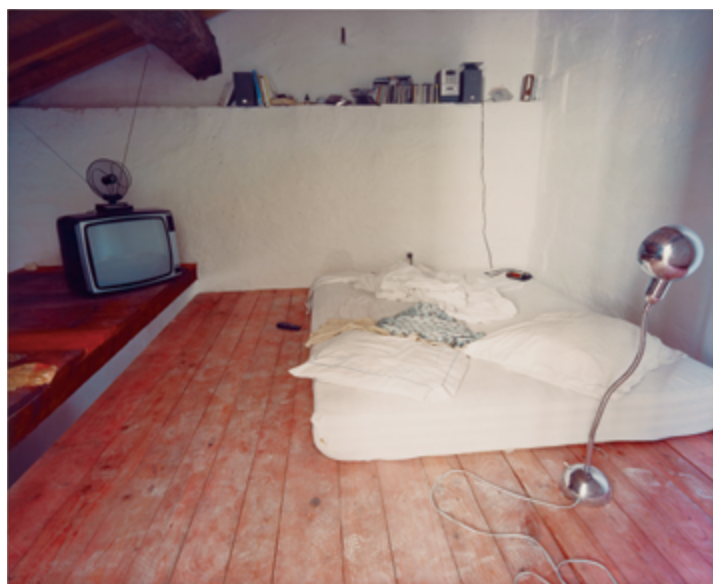
Clara Gutsche Arles de la série / from the series Les chambres , 2000 épreuve couleur / colour print, 76 × 95 cm acquisition en cours / in process