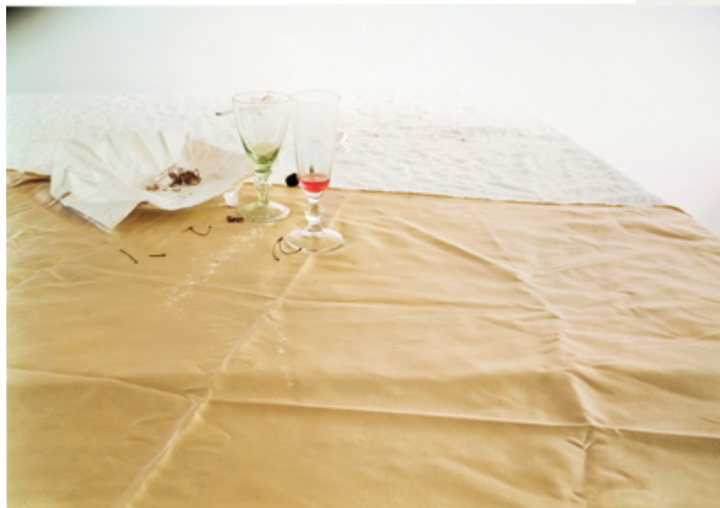
Laura Letinsky Untitled No. 48 de la série / from the series I did not remember I had forgotten 2002, tirage / print 2007 / épreuve couleur / colour print 61 × 89 cm

Puits de lumière (2014), c'est la construction géométrique d'un escalier intérieur, avec sa moquette baroque, qui domine, ainsi que la provenance de la lumière dans ce « puits » ; en effet, comme par inversion, la lumière émane étrangement des étages inférieurs et non du toit comme on pourrait s'y attendre. Quelle est donc cette mystérieuse source lumineuse qui habite littéralement l'escalier et son garde-fou, et leur donne forme ? Serait-ce l'esprit de la photographie ?