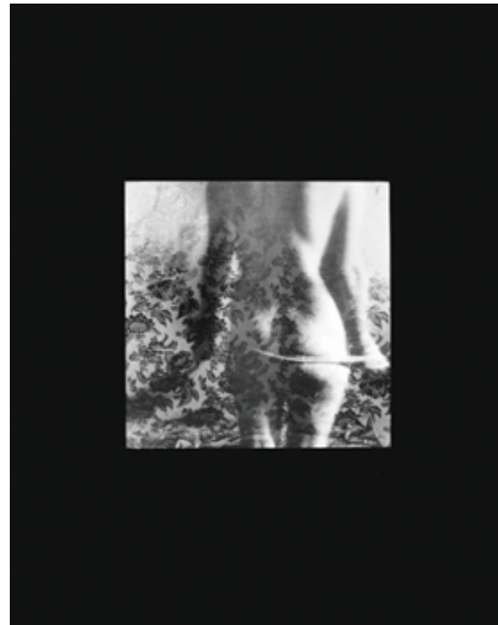
Éliane Excoffier Kiev (V) , 2008 épreuve argentique / silver print 49 × 39 cm

a potentially devastating visual beauty and the body of a subject who may be suffering from the disease, the link created by the parallel placement of the two pictures encourages a reflection on the illusion and precariousness of beauty. This work opened the way to an entire wall devoted to documentary-type photographs; in turn, Julie Moos, Claire Beaugrand-Champagne, Clara Gutsche, Sarah Anne Johnston, Lorraine Gilbert, Catherine Opie, and Katy Grannan put us into contact with women, men, young people – tree planters, athletes, apprentice, contractor, soldiers, tattooed man and woman, red-haired girl – who represent “ordinary” people in their daily life. These works, dated from 1987 to 2012, continue the documentary tradition of depicting ordinary people, the middle class, even marginalized people, to give them a voice and crystallize their existence.