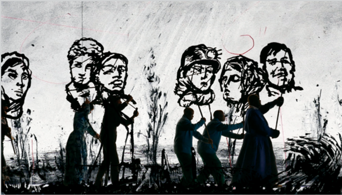
William Kentridge, More Sweetly Play the Dance , 2015, permission de la LUMA Foundation et de la Marian Goodman Gallery

le 11 septembre, dans l'exposition Nothing but the blue skies , mêlant des installations contemporaines et des films, des peintures et des photographies de cette tragédie ultramédiatisée qui a marqué un tournant dans l'histoire vi-