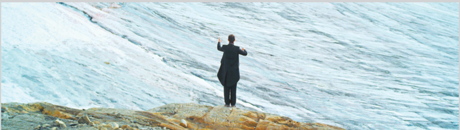
Paul Walde, Requiem for a Glacier , 2012–14, still from 2-channel video installation with sound

The works in Edge of the Earth are in dialogue with one another, in and across five thematic sections. Whereas