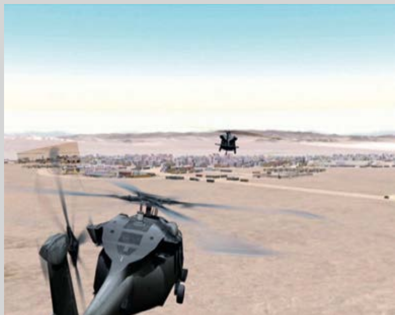
Serious Games 2, Three Dead , 2010, still from video installation, courtesy of the Green Naftali Gallery, NY