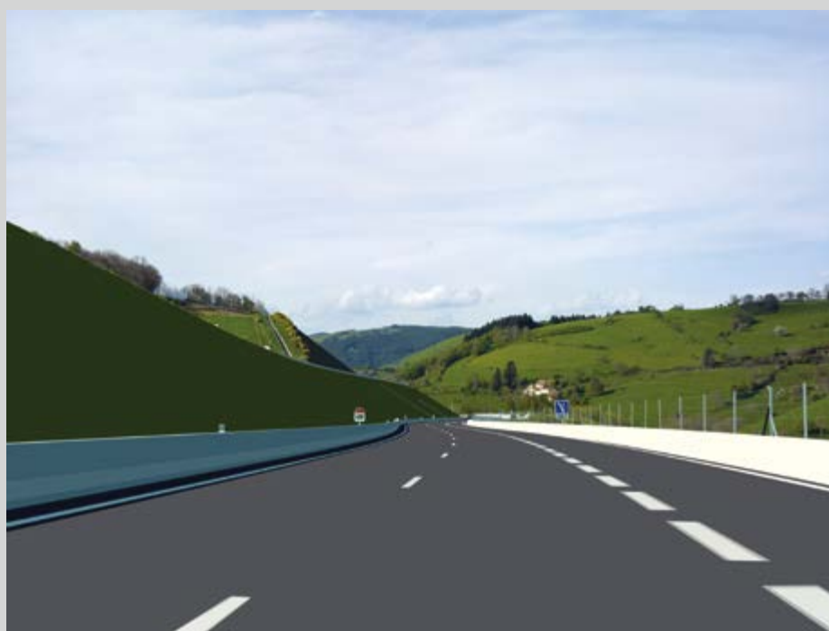
Alain Bublex, de la série L'optimisme au départ n'est plus de saison , 2014, permission de la galerie GP&N Vallois, Paris et Magnum Photos

En effet, dans les photographies de paysages, aux couleurs toujours très sombres, les arbres et les ciels torturés se chargent de menaces, de tensions sur le point d'exploser, dans un univers isolé et désolé qui semble avoir englouti les hommes mais non les spectres. Quant aux compositions en noir et blanc mettant en scène les relations humaines, elles apparaissent comme nourries du géométrisme inhérent à l'autoroute, tout en lignes, en trajectoires, en répétitions, comme si