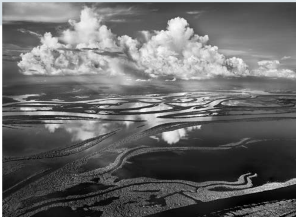
Sebastião Salgado, The Anavilhanas , the name given to around 350 forested islands in Brazil's Rio Negro, form the world's largest inland archipelago. Covering 390 square miles (1,000 square kilometers) of Amazonia, they start 50 miles (80 kilometers) northwest of Manaus and stretch some 250 miles (400 kilometers) up the Rio Negro, as far as Barcelos. Amazonas, Brazil, 2009.

following the format of Nadar's Revolving Self-portrait (1865). In After Nadar: Pierrot Turning (2012), Maggs again entered the picture as whiteface mime, and with each turn he gave slices of himself, as had Nadar and Kertész before him.