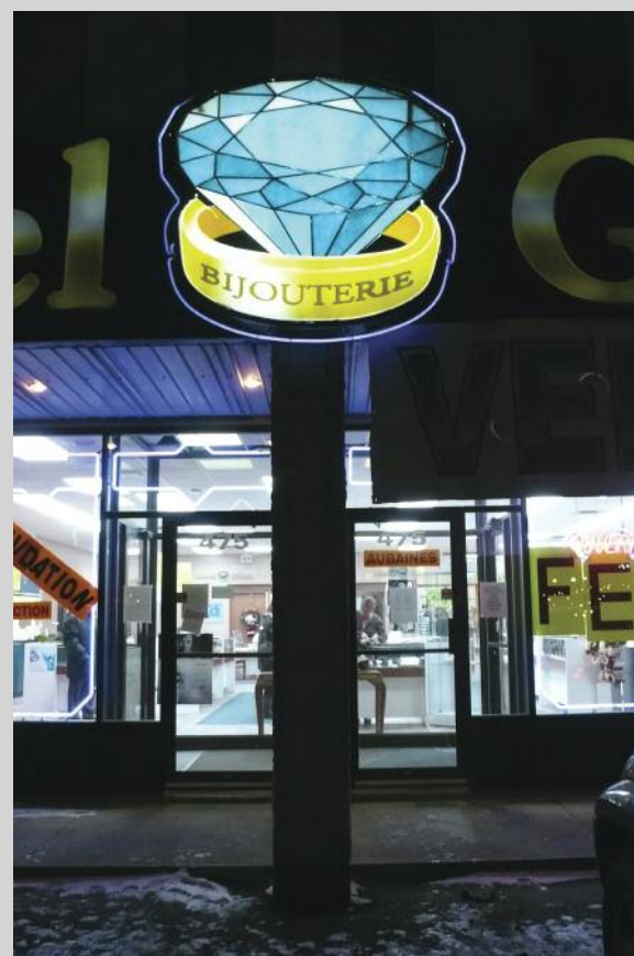
Emmanuel Galland, TOTEMS 14 , 2012, série de 22 photographies, impression jet d'encre

de vue (légèrement en plongée), les scènes extérieures ont été captées par les neuf caméras de l'automobile de Google et ont annexé certains fragments de vie au site Google Street View. Elles ont été découvertes par l'artiste, après de nombreuses heures de recherches sur le site Web. Pour trouver des situations, des coïncidences, des anecdotes, Rafman parcourt virtuellement les millions de kilomètres que la voiture de Google a sillonnés physiquement. Rafman s'approprie ensuite ces images empruntées au géant d'Internet et met ainsi en relief différentes problématiques du monde que la voiture a permis de saisir. Travaillant à la fois sur l'immensité du territoire et sur l'anecdotique, Rafman nous propose certaines scènes dérangementes, d'autres poétiques, quelques-unes même amusantes. Il cherche minutieusement un moment marquant ou un paysage pour devenir, comme il le dit si bien, tour à tour photographe du moment décisif à la Cartier-Bresson ou photographe de paysage. En recadrant avec précision les prises de vue du lieu ou de la scène choisis, en s'appropriant les images, il devient alors lui-même