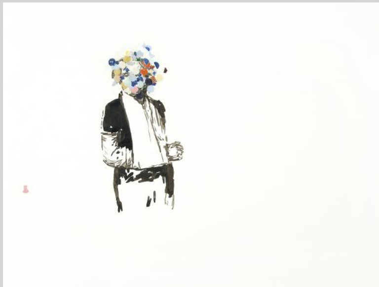
Sans titre, 2001, encre, confettis et ruban gommé sur papier aquarelle, 36 x 48 cm