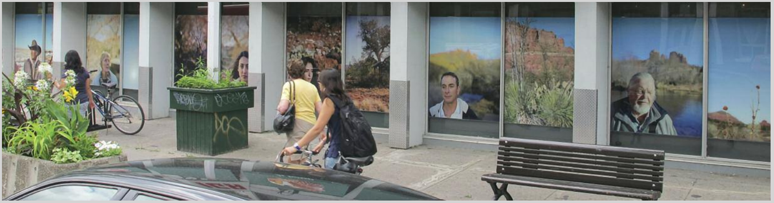
Andréanne Michon, Charm Strange , 2012, installation view, À louer / For Rent project

Some of the highlights: Jessica Auer's three huge photographic images, installed on the walls of an empty storefront on Centre Street in Point St. Charles, take your breath away from the get-go. They are simply magnetic and pull viewers effortlessly into them: a spiral jetty; the archipelago-like outcropping of a glacier on which a lone figure stands; a mountain threshold teeming with tourists. And she holds us captivated. Her casual authority is such that we seem on the brink of an invisible