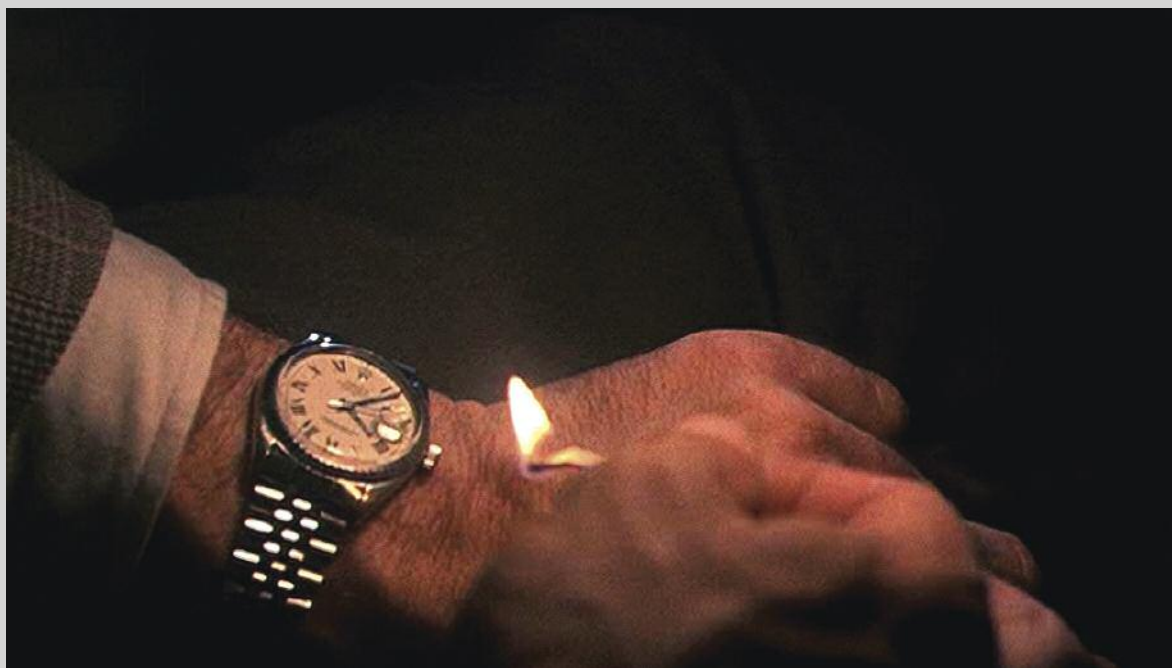
The Clock , 2010, vidéo à canal unique, durée : 24 heures