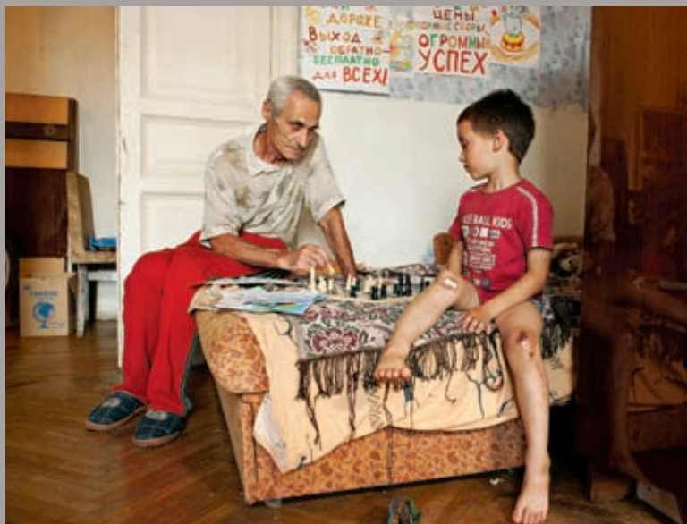
Chess with Grandson, 2011, épreuve chromogénique, 100 x 134 cm

Dans cette exposition, Hannah poursuit sa série des Stills , son corpus de travail le plus important, dans laquelle il s'intéresse à ce qui subsiste de la vidéo lorsqu'elle est dépourvue de son et de mouvement. Il en