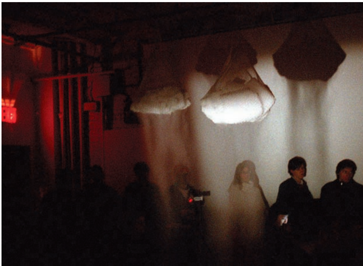
Two Hanks , 2003, Performance documentation / Photographies prises lors de la performance, Canada Gallery, New York, courtesy of / permission de Collection of the estate of the artist and Canada Gallery, New York