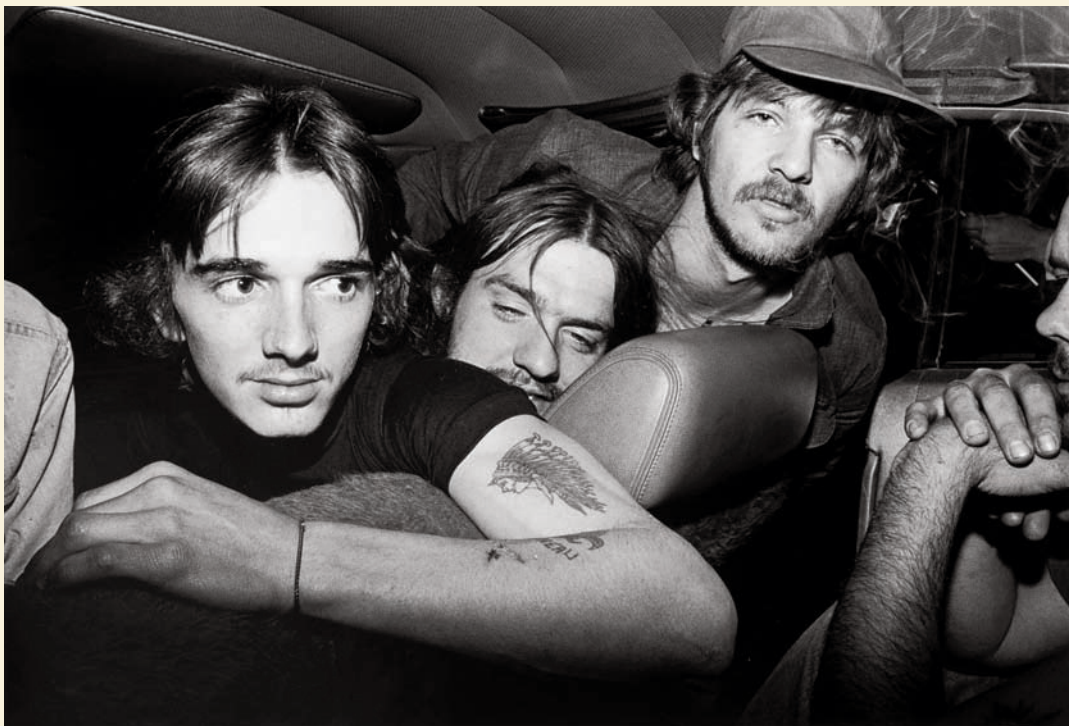
Normand Rajotte, Transcanadienne, Sortie 109, Jeunes dans une auto, 1977, épreuve argentique / gelatin silver print, 30,5 x 45 cm, Musée des beaux-arts du Montréal / Montreal Museum of Fine Art

[...] c'est peut-être cet intérêt particulier pour l'évolution du genre documentaire qui permettra à cette collection de se démarquer parmi les institutions canadiennes.