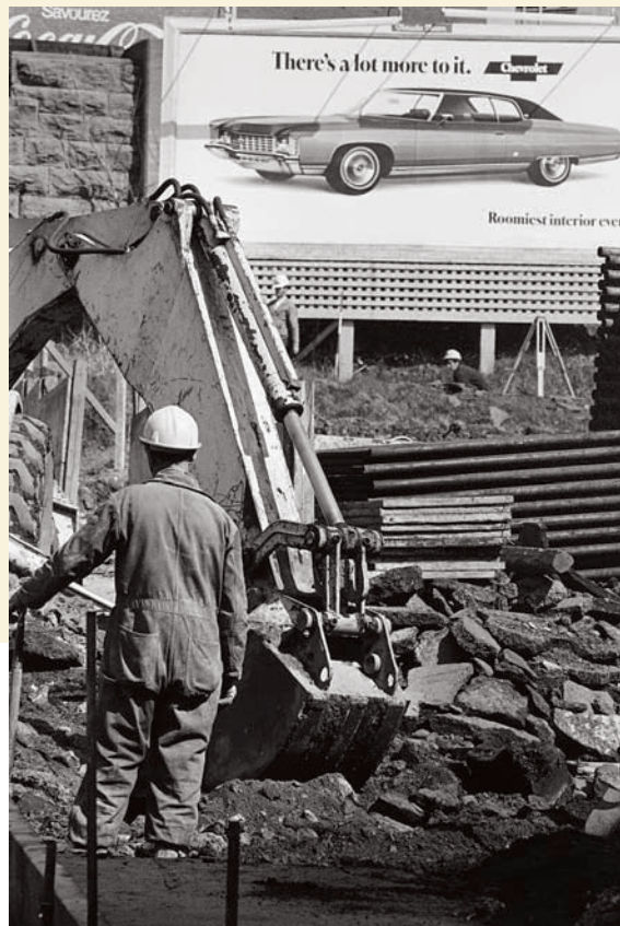
Brian Merrett, de la série / from the series Autoroute Ville-Marie , 1971, impression au jet d'encre pigmentée à partir d'un négatif numérisé / inkjet print from a pigmented scanned negative, 30,4 x 20,6 cm, Musée des beaux-arts de Montréal / Montreal Museum of Fine Art

especially within the sphere of contemporary photo-based artworks. 1 Significantly, this momentum has been maintained by the current director and chief curator, Nathalie Bondil, and has even been taken up a notch thanks to her enthusiasm for Quebec art in general.