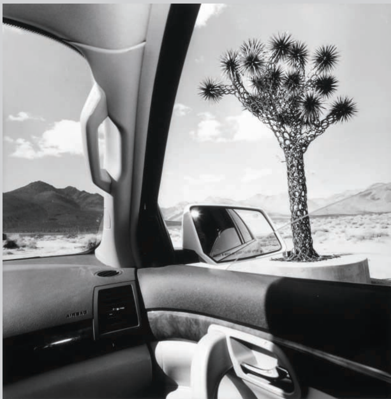
Lee Friedlander, California, 2008, from the series America by Car, 1995-2009, gelatin silver print, 38,1 x 38,1 cm, courtesy Fraenkel Gallery, San Francisco