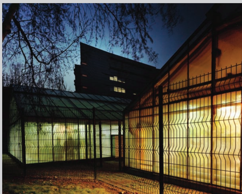
Ève K. Tremblay , Tropismes , 2006, c-print, 100 x 125 cm.