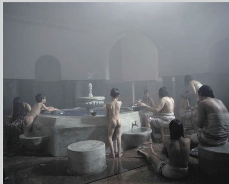
Women Without Men, 2009, image tirée du film, 95 min