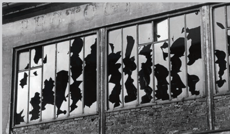
Brassaï, Sans titre , vitres cassées d'un atelier de photographe, c. 1934, épreuve argentique, 17,3 x 29,8 cm, Musée Folkwang, Essen

Quelque vingt-cinq ans après Explosante fixe . Photographie et surréalisme , exposition conçue en 1985 par Rosalind Krauss et Jane Livingston, le Fotomuseum Winterthur présente une exposition 1 d'envergure qui entend recenser et analyser les diverses fonctions assignées par les surréalistes aux images indicielles. À l'aide de plus de 400 œuvres plastiques, une dizaine de films et une centaine de documents, distribués suivant neuf sections thématiques, l'exposition rassemble les travaux de ces figures de proue du mouvement que sont Man Ray, Kertesz et compagnie, mais présente aussi des œuvres moins connues – envoûtantes mises en scène photographiques d'Artaud, par