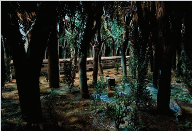
David Hoffos, Scenes from the House Dream: C.P. Fail (detail), 2008, installation, courtesy the artist and Trépanier Baer Gallery, photo: David Miller

The soothing, immersive atmosphere that Hoffos creates for his work sets it apart from Tony Oursler's disturbing spectacles and Wyn Geleynse's discreet constructions, though these artists too, project moving characters onto constructed models. The total enclosure of Scenes from the House Dream allows for a withdrawal from