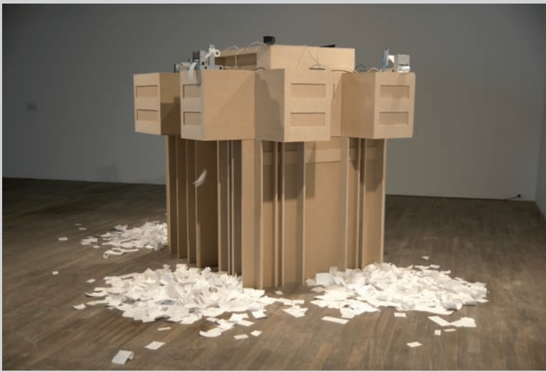
José Carlos Martinat, Stereo Reality Environment 3: Brutalismo , 2007, installation interactive, coll. du Tate Modern

politique au Pérou dans les années 1980] entre des écrans (allumés puis soudainement éteints par des explosions [terroristes causées par le Sentier lumineux]) qui montraient des jeux vidéo et des dessins animés, en alternance avec des bulletins d'information annonçant l'hyperinflation, des épidémies, des génocides et la destruction » 1 .