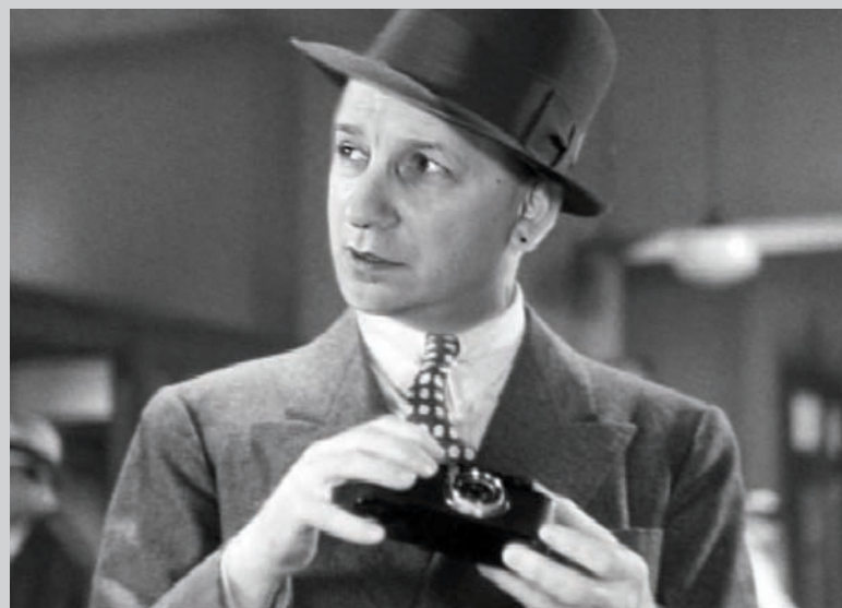
Chuck Samuels, Untitled , de la série Chuck Goes to the Movies , 2009, installation photographique, épreuves numériques, 108 photographies, 20,3 x 25,4 cm ch.

En fait, Samuels dévoile la profonde artificialité des deux médiums. En explorant la relation qu'il entretient avec l'image, il tente de comprendre la relation qu'il a entretenue avec son père. Mais ce faisant, il met les visiteurs de l'exposition devant leurs propres contradictions et