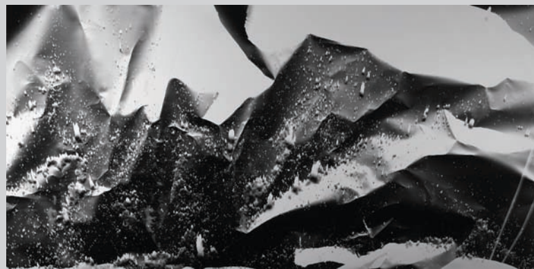
Michael Flomen, Crunchtime No. 1 , 2009, unique photogram, 122 x 244 cm, courtesy of Galerie Pangée.

While Lyle Rexer's show presents an educated and conscious sense of the history of photography, the accompanying publication opens up the incredible range of techniques and approaches to abstraction in which today's photographers engage. Viewers less well versed in photography may, however, find the visuals less astonishing