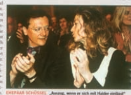
ENFANGSCHÜSSEL: „Aber, wenn er sich mit Haider einigt“

Bei der gemeinsamen Pressekonferenz von Schüssel und Haider am Dienstag vergangener Woche gab der Kanzler seinen neuen Kampagnen sogar in aller Öffentlichkeit rituelle Anweisungen.