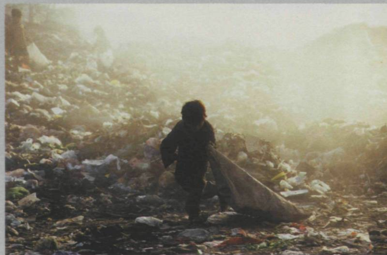
Paul-Antoine Pichard, Dakar - Sénégal , 2001, c-print, 70 x 100 cm

In these documents, we see people who live in makeshift villages, families who farm the trash and live their entire lives breathing in the toxic fumes, smoke, and methane that are part of these environments. These people recycle metal, find basic food, and try to sell some of what they find. This daily heaven-and-hell existence is the norm for tens of thousands. The colours in these literal and visual landscapes of trash are vivid. Amid the mountainous volumes of