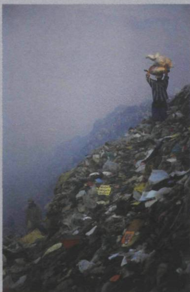
Paul-Antoine Pichard, Dakar - Sénégal , 2001, c-print, 100 x 70 cm

A neglect for basic human rights leads to the environments and situations that the people in Pichard's photographs inhabit. These works are completely at odds with the nuanced, distant, cold, and antiseptic industrial-scaled approach of much contemporary photography that deals with these issues. Pichard's photographs reflect an ongoing social commitment and conscience. These photo-scapes, for all the trash and pollution, are quintessentially human-scapes that engage this global situation and the issues that they reflect with compassion and a sense of urgency.