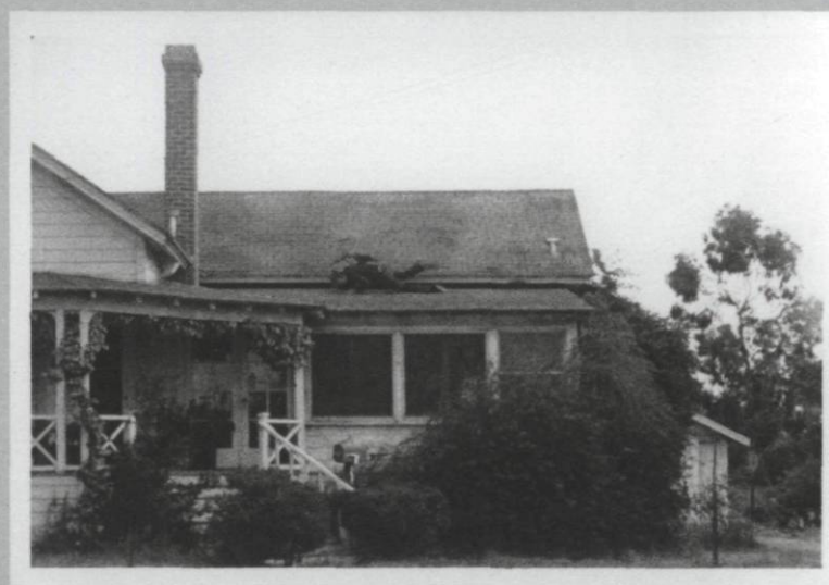
Bas Jan Ader, Fall II, Amsterdam , 1970, film 16 mm transféré sur DVD, 25 secondes

faisant le sujet et l'objet de ses dérisoires et sérielles entreprises icariennes détournées à vide toute quête d'héroïsme qui ne correspond plus au monde dans lequel il intervient.