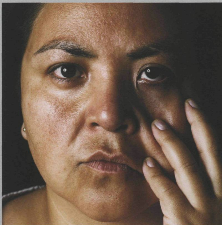
Arthur Renwick, Eden , 2006, épreuve au jet d'encre, 116 x 111 cm, collection du Musée des beaux-arts du Canada, Ottawa

Sur le mur à gauche les photographies de Jeff Thomas (Onondaga), extraites des séries Les quatre rois indiens , Domination des guerriers ou Le délégué , s'étaient à l'horizontale à hauteur des yeux sous la forme du grand Wampum huron-iroquois Hyawatha. Certaines images mêlaient peintures