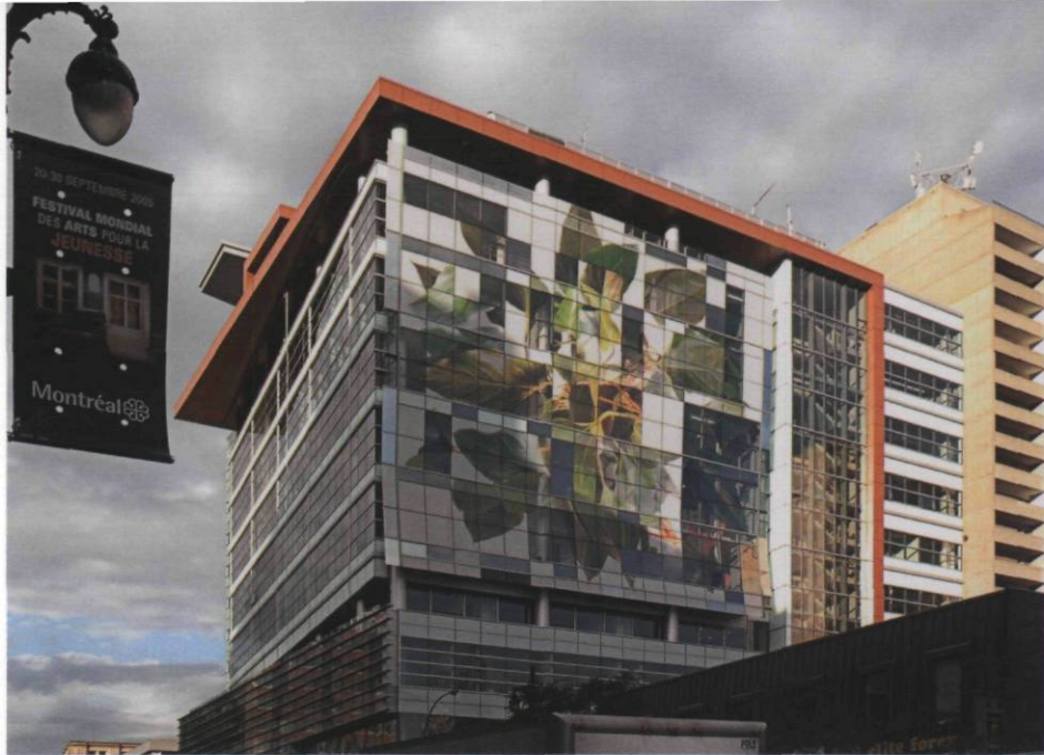
Nicolas Baier, Sans titre , 2003, matériaux mixtes, superficie de 1829 m 2 , programme d'intégration de l'art à l'architecture du Québec, Université Concordia, Montréal