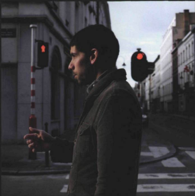
PAGE 21 Florian Böhm , 53rd St & 5th Ave , 2007, de la série Wait For Walk , photographie, 300 x 110 cm, reproduite avec l'aimable permission de MAP

Vue de l'exposition Paysages transformés , 28 février 2009, vitrine du boulevard St-Laurent, Montréal, reproduite avec l'aimable permission de MAP