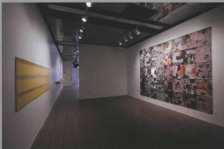
Vues d'installation de l'exposition

Chez Mahé, deux stratégies se côtoient : la première met en branle une trajectoire