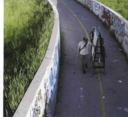
SYN-, Hypothèses d'insertions , Hull/Gatineau, 2002 installation in situ LES VISITEURS DES ESPACES INTERSTITIELS

V ous possédez un ordinateur, qui est branché sur un serveur. Vous tapez n'importe quel nom de lieu dans un quelconque moteur de recherche, vous cliquez sur « images » et voilà que le choix d'une multitude de photographies s'offre à vous ; vous pouvez les télécharger, les acheter, les mettre en signet, les voir et les revoir.