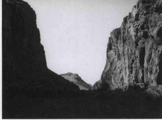
Mark Ruwedel, Devil's Gate #4 , épreuve argentique, 1997 L'OBSERVEUR DU PAYSAGE PERNICIEUX