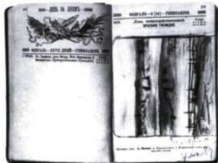
Pablo Picasso, il neige au soleil , calligraphie, 1934.