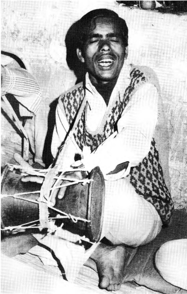
Barde en train de chanter.

nuit dans divers villages afin d'assister à des rituels et que, pour cause, nous nous levions très tard le lendemain matin; ils nous reprochaient de vivre à l'envers.