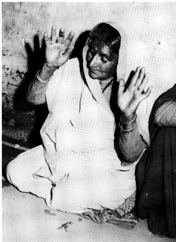
Médium en état de transe.

Le dieu qui a investi le corps du médium fait ensuite la distribution de cendres sacrées. Tout le monde en prend, car ces cendres sont censées être très bénéfiques. L'attention de la foule est alors à son maximum. Ceux qui reçoivent des cendres sont agenouillés et recueillis. Ils se concentrent sur le contact direct et physique qu'ils ont avec le sacré. Puis, par l'intermédiaire de la bouche du médium, le dieu s'adresse à la foule. Durant son discours, l'attention de l'assemblée se relâche un peu. Certaines personnes interrogent le dieu. Si ce dernier le demande, le jāgar terminera le lendemain matin