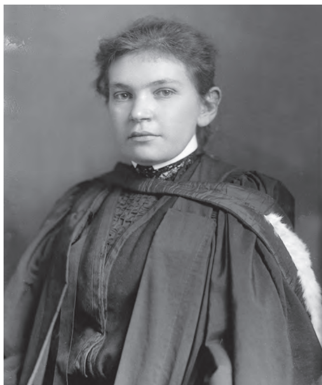
Fondé en 1822, le Musée a connu son âge d'or au début du XX e siècle, sous la direction de la médecin Maude Abbott.