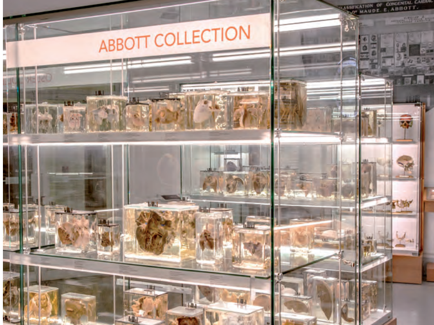
Depuis 2018, 300 des quelques milliers d'objets que possède le Musée médical Maude Abbott sont accessibles au public.

Par ailleurs, plusieurs objets rappellent la vocation éducative de l'établissement. Parmi eux figurent un crâne « à la Beauchêne » — ses os ont été désarticulés et remon-