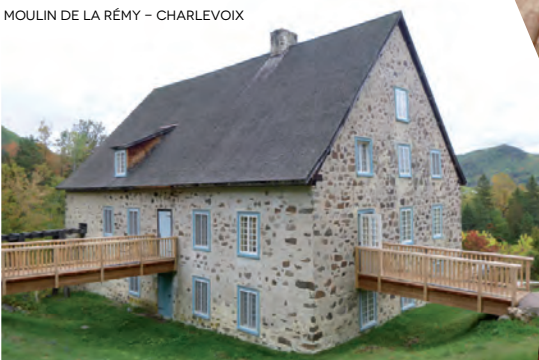
MOULIN DE LA RÉMY - CHARLEVOIX

Ces témoins du passé prolongent la vie des disparus. « C'est comme s'ils restaient un petit peu avec moi », formule celle que sa passion a conduite au métier d'archiviste. Ce coffret à