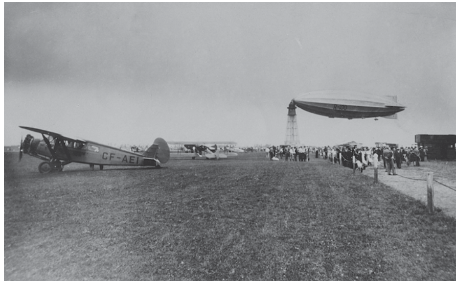
↑ Le dirigeable R-100 à l'aéroport de Saint-Hubert en 1930