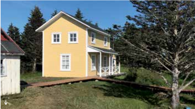
Maison natale de Gilles Vigneault