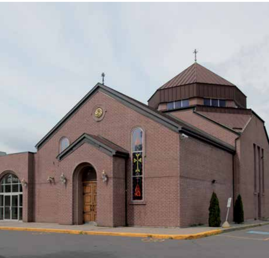
Conçue par l'architecte Dikran Gabriel et construite entre 1969 et 1973, l'église apostolique arménienne Sourp Hagop témoigne de la présence de cette communauté dans l'arrondissement d'Ahuntsic-Cartierville, à Montréal.