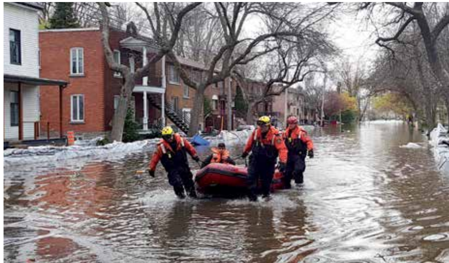
Inondations du printemps 2017 à Montréal