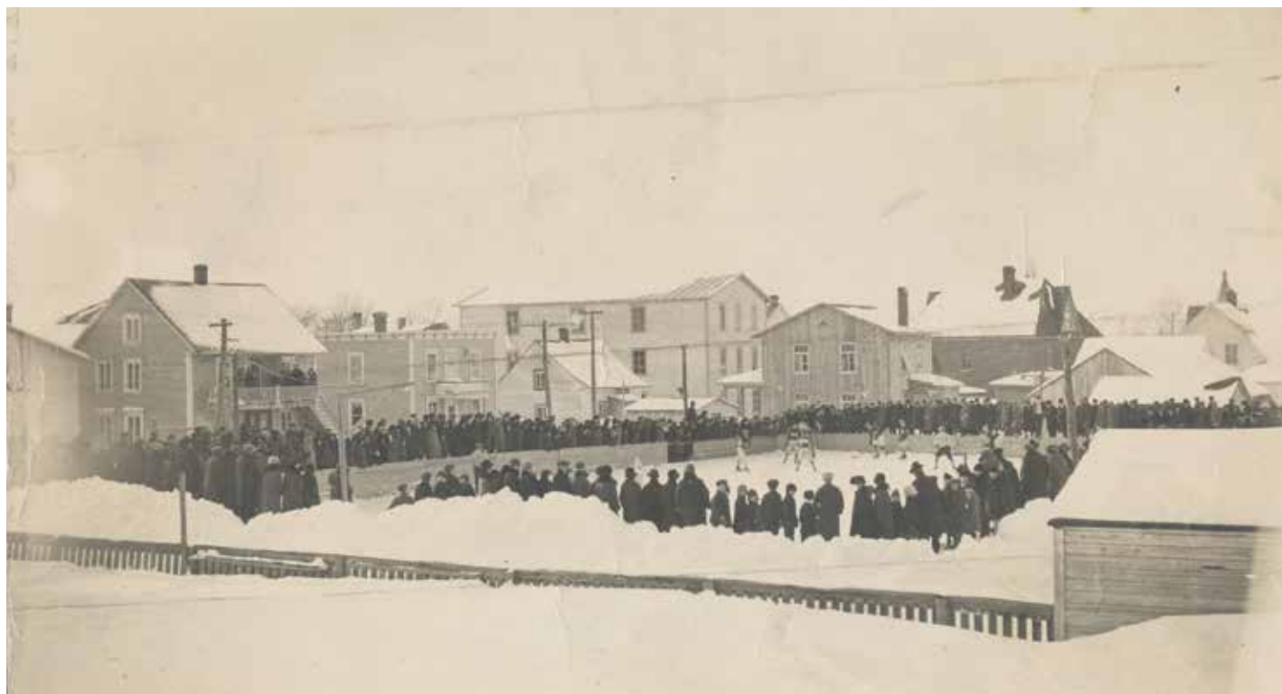
Patinoire extérieure de la rue Vézina à Trois-Pistoles entre 1924 et 1929