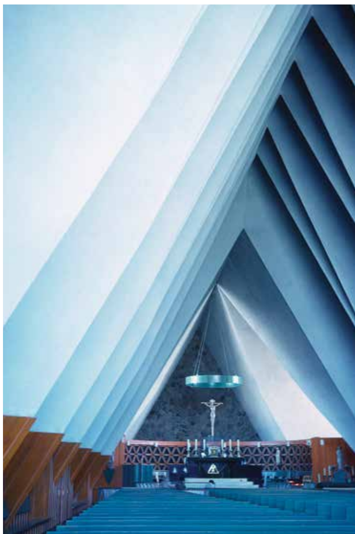
Comme plusieurs lieux de culte modernes, l'église La Bible Parle évoque une tente. Photo : Lévis Martin, 1963