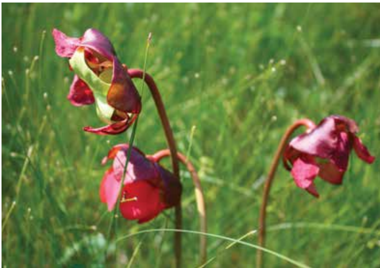
Parmi les noms officialisés au cours des dernières années figure celui du lac de l'Alicotache. Ce lieu est bordé de sarracénies, une plante insectivore appelée alikutash dans la langue innue.

Les lieux-dits jouent un rôle particulier à cet effet. Ces dénominations spontanées, utilisées par les populations locales, ont un lien significatif avec l'endroit qu'elles désignent. Sauf qu'elles ne sont pas officialisées en général. « Souvent, elles sont maintenues sur la base de l'oralité, précise M me Bouvet. La culture autochtone est particulièrement concernée. Malheureusement, si aucun effort n'est fait pour colliger ces appellations, elles risquent fort de disparaître, entraînant avec elles une continuité entre le passé et le présent. »