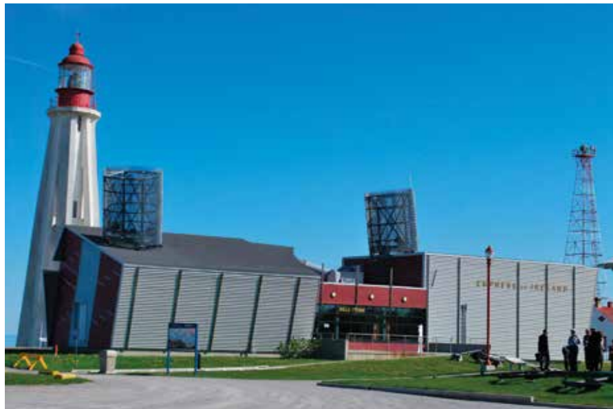
↑ Au Site historique maritime de la Pointe-au-Père, le Musée Empress of Ireland raconte l'histoire de ce paquebot et de la plus grande tragédie maritime du Canada.

Sa situation au cœur du village a valu au phare de La Martre (1906) le surnom de « Cadillac des phares ». Les quatre gardiens qui s'y sont succédé n'ont pas eu à endurer l'isolement qu'impose généralement leur métier. Le bâtiment de structure octogonale se démarque par son ossature en bois, unique sur la côte gaspésienne. Sans compter que son horlogerie d'origine assure toujours la rotation de son module d'éclairage. Tout près, le Musée des phares présente une exposition permanente sur l'évolution des lanternes de phares de 1700 à aujourd'hui.