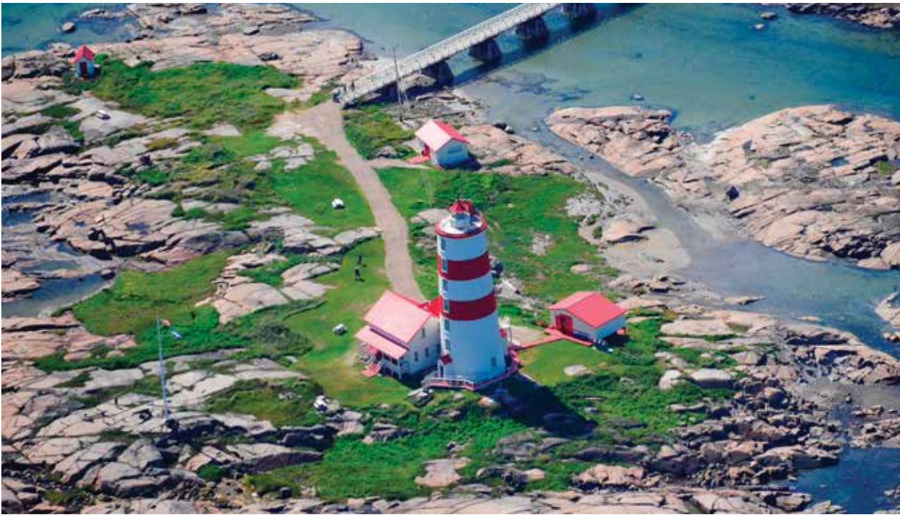
Les anciens gardiens du phare de Pointe-des-Monts, sur la Côte-Nord, ont mobilisé la population locale pour convaincre le gouvernement du Québec de préserver le bâtiment.